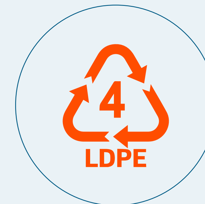
POLIETILENO DE BAIXA DENSIDADE