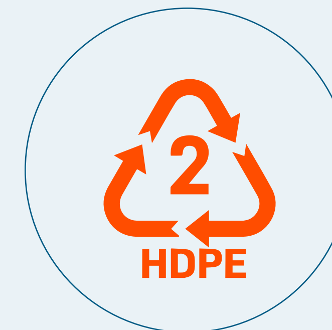
POLIETILENO DE ALTA DENSIDADE